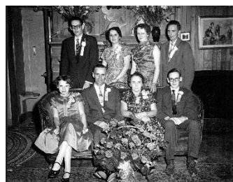
23 septembre 1956, sa famille à l'Auberge des Pins