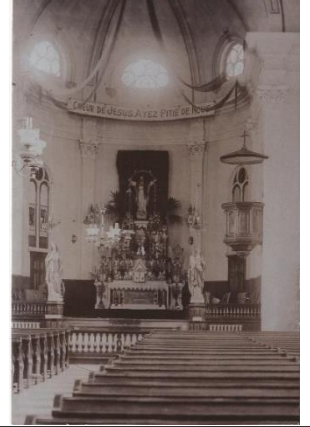
Intérieur de l'église

L'année 2018 marque le cinquantième anniversaire des rénovations intérieures de notre église. Les changements s'inscrivent dans la foulée de la réforme liturgique du concile Vatican II. Le prêtre se tourne vers les fidèles, les concélébrations sont favorisées, les chants font maintenant partie de la célébration et la messe se déroulera désormais dans la langue de chacun. Adieu le latin et le grégorien ! Afin de revivre cette année, nous suivrons les différentes étapes des travaux à travers les mémos de M. le Curé dans les feuillets paroissiaux de l'année 1968.